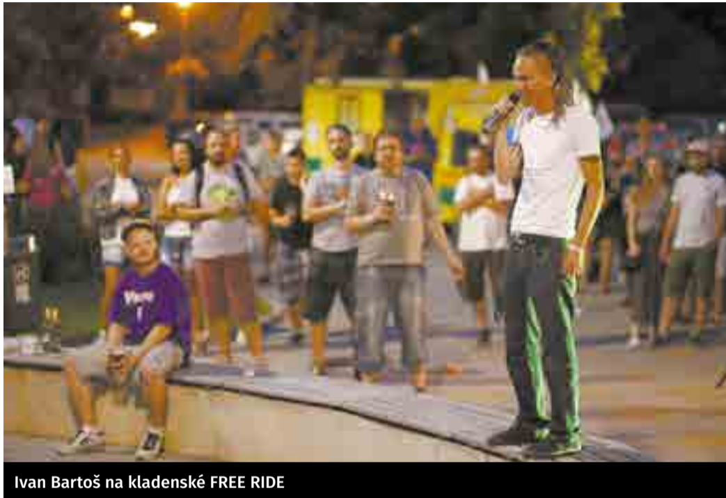
Ivan Bartoš na kladenské FREE RIDE

V kampani se opíráme o dobrovolníky, fanoušky, nápady a nadšení. Proto jsme vidět, přestože máme oproti největším stranám zhruba desetinový rozpočet. Přidat se můžete i vy, je to letos docela jízda. Hlavně ale 20. nebo 21. října přijďte k volbám a vezměte i přátele, kteří ještě váhají.