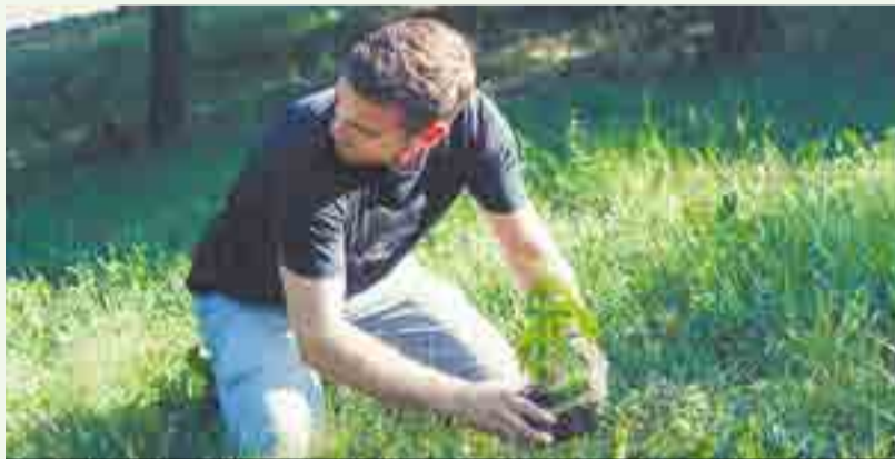
Legalizaci konopí věnujeme hodně úsilí a chceme ji zrealizovat správně.

konopí pěstované přes celé léto na prosluněné zahrádce (outdoor) dokážou dorůst i ke čtyřem metrům výšky a z každé může být získáno třeba půl kilogramu sušeného produktu. Vedle toho rostliny konopí pěstované pod umělým osvět-