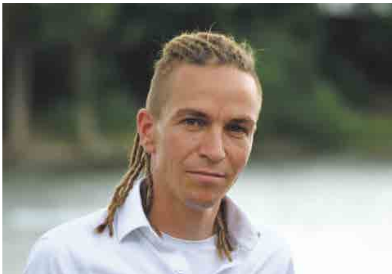
PhDr. Ivan Bartoš, Ph.D., předseda Pirátské strany

Před osmi lety jsme během dvou měsíců nasbírali potřebné podpisy a založili Pirátskou stranu. Za tři týdny nám pak lidé pomohli vybrat 210 000 Kč pro tehdy chystané předčasné volby. Postupně jsme prorazili do komunální, krajské ale i celostátní politiky. Kontrolujeme jak hospodaří obce a kraje, ve kterých jsme v zastupitelstvech, upozorňujeme na politické trafiky a zveřejňujeme informace. Navíc se snažíme politiku posouvat svobodomyšlnějším směrem a chránit lidi před šikanou.