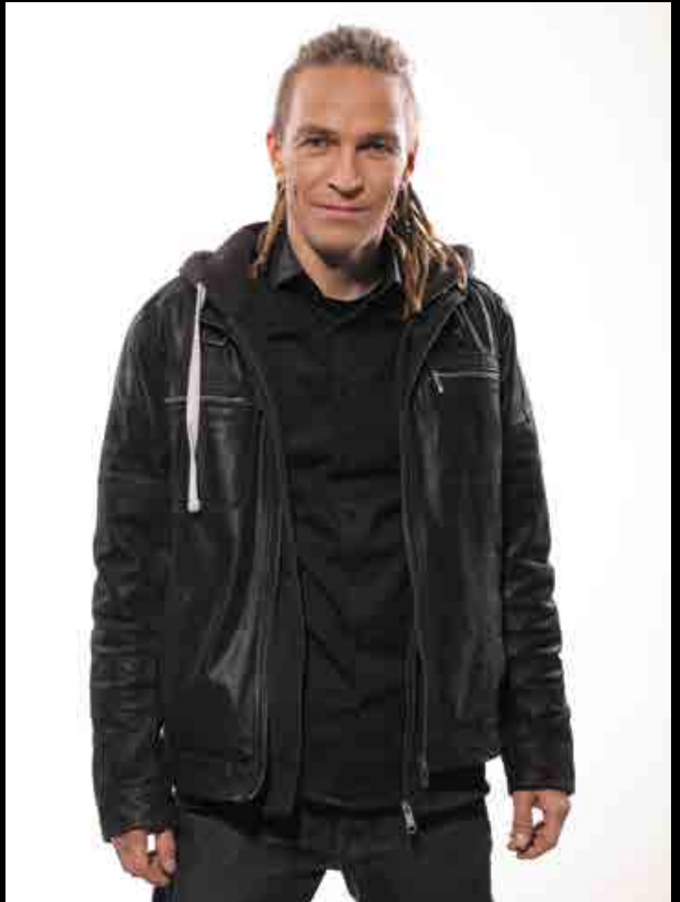
PhDr. Ivan Bartoš, Ph.D., předseda Pirátské strany, lídr Středočeského kraje

Hodně jsem cestoval, v USA i po Evropě, a myslím si, že naším vzorem by mohlo být Německo. To se s druhou světovou válkou vyrovnalo a společnost se úplně přenastavila. U nás to po válce kvůli komunismu bohužel nenastalo. Jde o řadu otázek, které liberální svět už neřeší a lidé se tam mají dobře. Není přitom žádný relevantní důvod, proč by to u nás nemohlo být taky tak. Pořád vidíme, jak nám roste HDP. Proč jsou tedy naše platy u čtyř pětín lidí nižší než minimální mzda v Německu? Není žádný důvod, proč být chudí. Veřejné zakázky např. nezohledňují kvalitu, podmínky pro zaměstnance, zodpovědnost firmy vůči svému okolí. Ani stát tedy reálně strukturou objednaných prací nepodporuje vyšší mzdy v komerčním sektoru. A navíc vidíme úniky, systémovou korupci na úrovni