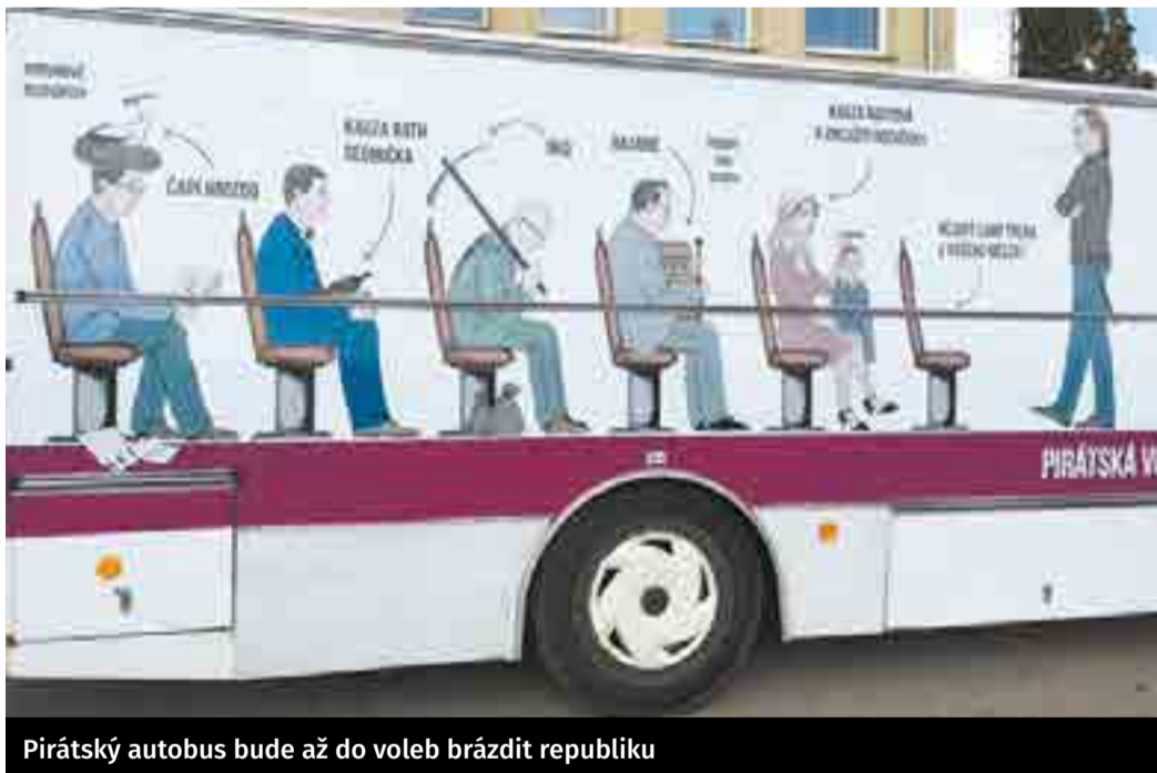
Pirátský autobus bude až do voleb brázdit republiku

Vstupné na veškeré akce je samozřejmě zdarma. Aktuální program akce naleznete na facebookových stránkách Pirátská Free Ride Tour 2017. Přijďte se pobavit.