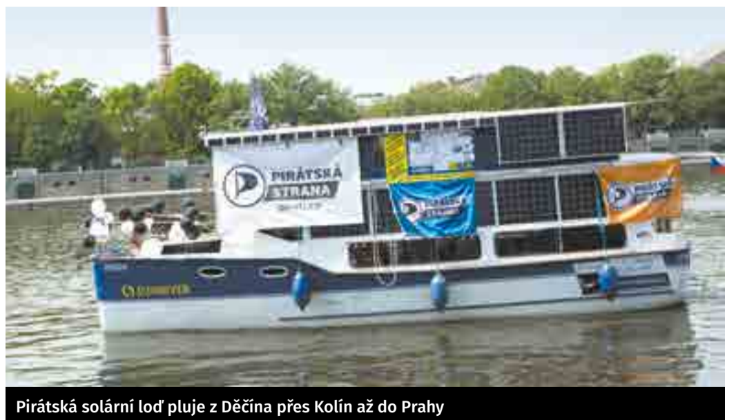
Pirátská solární loď pluje z Děčína přes Kolín až do Prahy

Ten sice pořádá vlastní Free Ride Tour po Středních Čechách, ale je i občasným členem posádky lodi. Již první víkend se zúčastnil návštěvy Ústí a Děčína v severních Čechách. Naši pirátskou loď budete moci spatřit, navštívit anebo se dokonce i svézt, a to až do konce září. Všichni jste srdečně zváni na palubu – společně na jedné lodi až do Parlamentu!