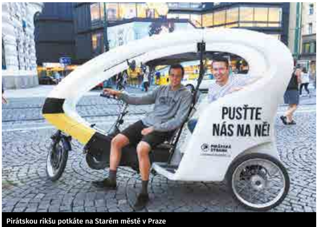
Pirátskou rikšu potkáte na Starém městě v Praze